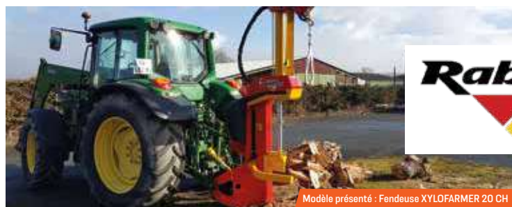
Modèle présenté : Fendeuse XYLOFARMER 20 CH